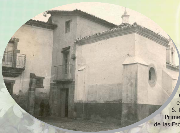
Casa situada en la Plaza de S. Benito. Primera vivienda de las Esclavas.

Ella decía que sus privilegios debían ser tomar en todo la peor parte.