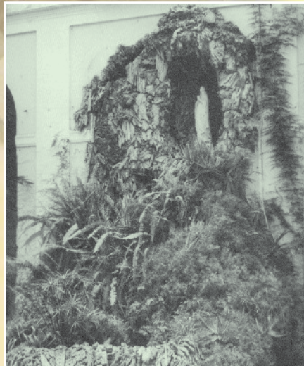
Gruta de la Virgen de Lourdes (Antiguo colegio de la calle Liborio García - Málaga).

“Es necesario que traten a las niñas como verdaderas madres, que las atiendan, las guíen y las amen”.